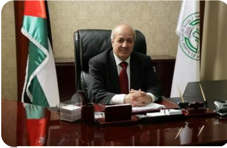
كلمة رئيس الجامعة، الاستاذ الدكتور رشدي علي حسن