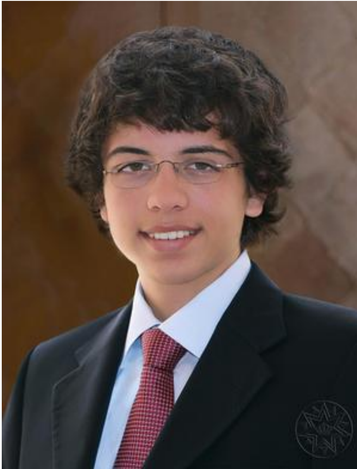
حضرة صاحب السمو الملكي الأمير حسين بن عبدالله الثاني ولي العهد المعظم