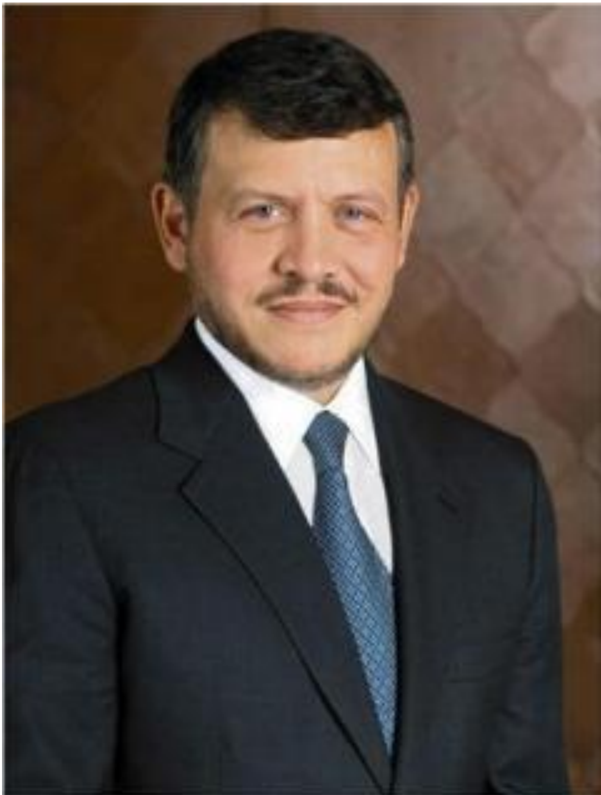
حضرة صاحب الجلالة الملك عبدالله الثاني ابن الحسين المعظم